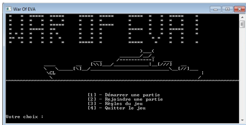
Figure 1: Écran d'accueil

Cet exercice propose une série de questions conduisant à la création du jeu war of EVA.